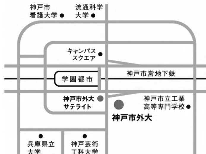
〈学園都市駅周辺地図〉