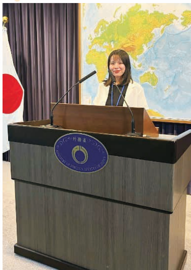
2024年3月ロシア学科卒業