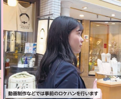
動画制作などでは事前のロケハンを行います