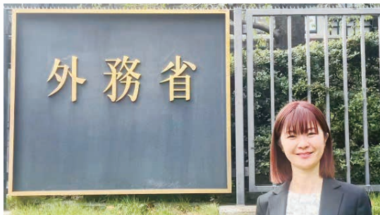
2009年3月ロシア学科卒業