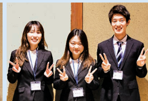
A little innovators