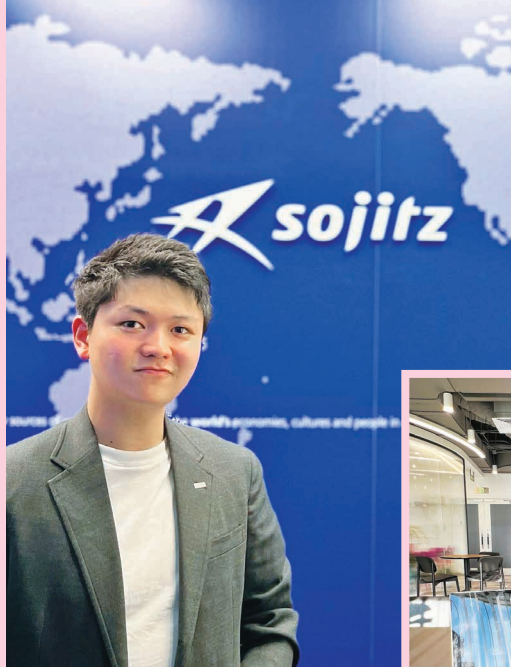
当社北京オフィス。フリーアドレス制となっており、陽当たりの良い窓側席を良く利用していました。▶

未曾有のパンデミックを経て、殊に外大では私の在学中とは全く異なったキャンパスライフを強いられた方々も沢山居られるのではと考えます。一方、学生生活の過ごし方の最適解は1つである筈がなく、変化へ柔軟に対応してゆく事こそが強さだと私に教えてくれた母校に在籍される皆様だからこそ、1人1人が自分の最適解へ向け邁進されている事と存じます。好奇心の向かう方向へ全力で走っている皆様を、卒業生として陰ながら応援しております。また、今後も多くの受験生の皆様に神戸市外大を選んで頂けるのであれば、それは大変喜ばしい事であり、皆様の期待に相応しい学びの場であると私は信じています。