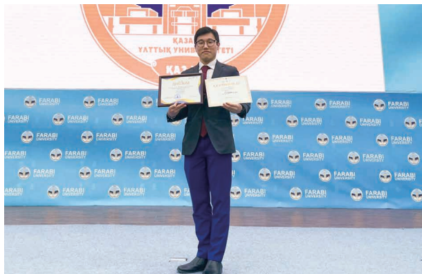
カザフ国立大学の論文発表で準備学部の部門で1位になり、他の学部の方と共に表彰されました。

自分が学んできた言葉を通して現地で様々な国籍、民族の人々と会話でき、彼らの生活、文化、考え方に触れることができる貴重な機会だったと思います。