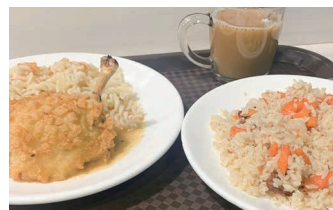
ウズベク料理のプロフとキエフ風カツレツ(チキンカツの中にバターが入っている)旧ソ連地域の様々なご飯を食べることができるのもカザフスタンのいいところです。

カザフスタンで最も歴史がある大学だけに学内のイベントが多彩でした。実際にナウルーズ(中央アジアの春分の日)や学生論文コンテスト、旧ソ連地域の他大学の交流など様々なイベントなどに参加しました。