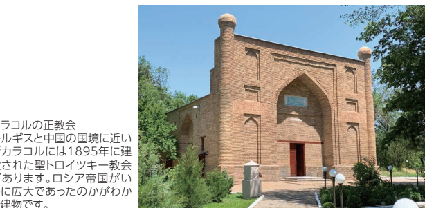
カラコルの正教会 キルギスと中国の国境に近い街カラコルには1895年に建設された聖トロイツキー教会があります。ロシア帝国がいかに広大であったのかがわかる建物です。