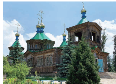
カザフスタンの街タラズにあるカラハン朝チュルク系イスラーム王朝、カラハン朝の創始者の霊廟です。他にもタラズにはアイシャビドゥルなど見どころがあります。

具体的には考えきれていないのですが、いつかもう一度中央アジアに戻り、何かしらできればと考えています。日本国内では中央アジアレストランを日本で経営して中央アジアの知名度を高めたいです。