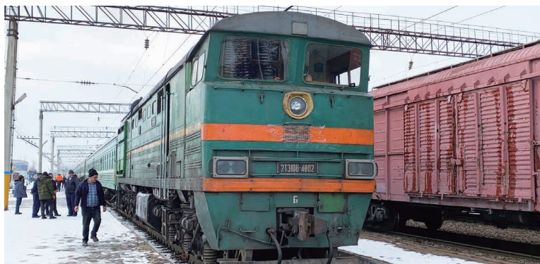
鉄道キルギスへ ロシアのノヴォシビルスクからカザフスタンのアルマトイを経て、キルギスのビシュケクへ向かう国際列車が運行されています。

長期休暇中の鉄道旅です。カザフスタン国内を寝台車に乗って旅行した際には現地の方々と会話したり、お茶を振る舞って頂いたり、人の温かさに触れることができました。また、カザフスタンからキルギスへの寝台車に乗った際にはキルギス出身でロシアの大学で学んでいる学生やカザフスタン在住でキルギスを経由してウラジオストクに仕事に行く人に出会い、旧ソ連地域は互いに今も結びつきが強いということを実感することができました。