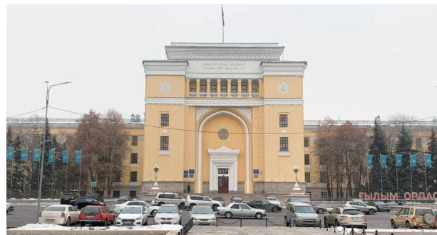
カザフスタン科学アカデミー カザフスタンの最高学術機関です。1957年に建設されました。日本人の戦争捕虜が建設に従事した歴史があります。