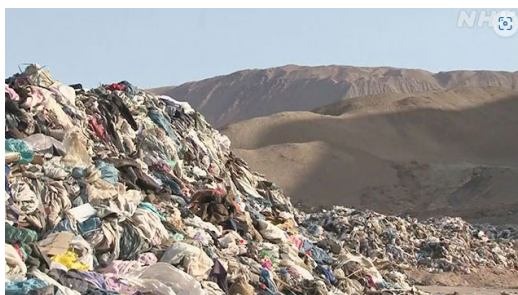
写真1:アタカマ砂漠の「衣類の墓場」

写真1を参照していただきたい。砂漠にゴミのようなものが積みあがっているのが見て取れる。ここは南米チリの北部に広がるアタカマ砂漠であり、「衣類の墓場」とも呼ばれる。この捨てられた衣類は、写真に写るこの場所だけでも10万トンに上るとみられている(イメージしにくいので、比較のために補足しておく。豪華客船ダイヤモンド・プリンセス号が11.5万トンである)。