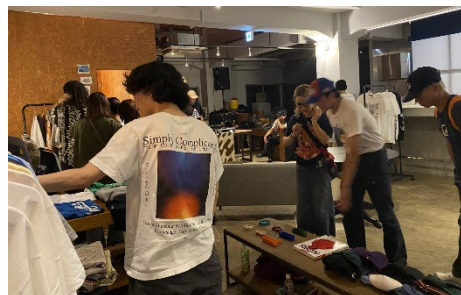
写真 3: 古着イベントで服を選ぶ人たち

り、大学生を中心に活気づいていた。ちなみに彼らはSDGs の波及のためではなく、単に「古着好きだから自分たちでも売ろうぜ」という心意気でこのイベントを開いている。意識はしていないが、結果的に社会問題の解決に繋がっているというところが何とも粋である。